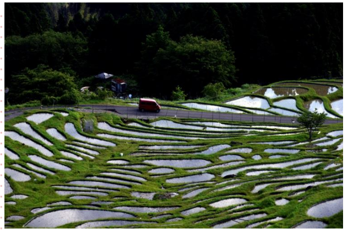
都市(まち)からの便り 於:熊野市丸山千枚田

前回のニコニコ ¥40,000 全期会費預かり分 ¥1,665,000 今年度累計 ¥3,243,450